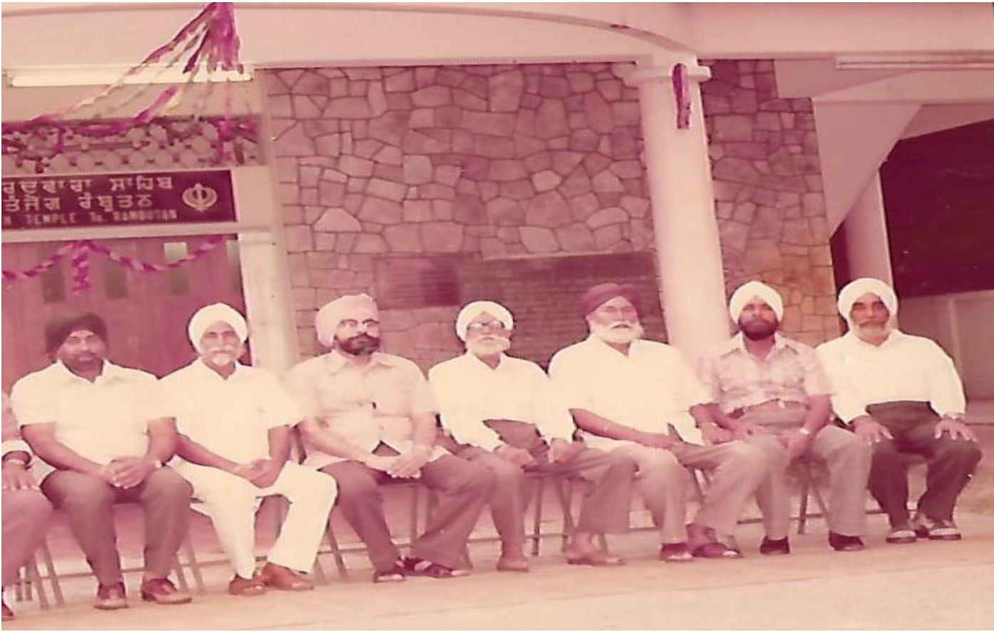
(ਗੁਰਦੁਆਰਾ ਸਾਹਿਬ ਤੰਤੋਂਡ ਰੰਬੂਤਨ ਦੇ ਪ੍ਰਬੰਧਕਾਂ ਤੇ ਵਿਦਿਆਰਥੀਆਂ ਵੱਲੋਂ ਵਿਦਾਇਗੀ)