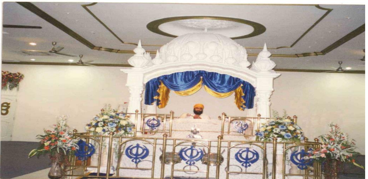
(ਵਿਕਟੋਰੀਆ ਗੁਰਦੁਆਰ ਸਾਹਿਬ ਦਾ ਦੀਵਾਨ ਹਾਲ)