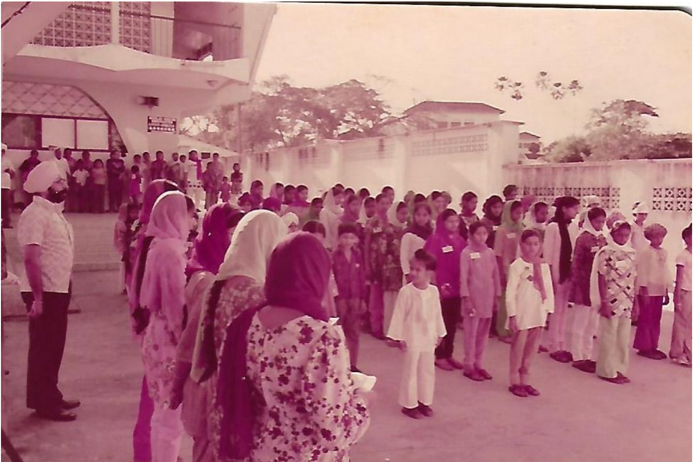
(ਗੁਰਦੁਆਰਾ ਬੱਟਰਵਰਥ ਵਿਖੇ ਲਾਏ ਗਏ ਕੈਂਪ ਦਾ ਦ੍ਰਿਸ਼)