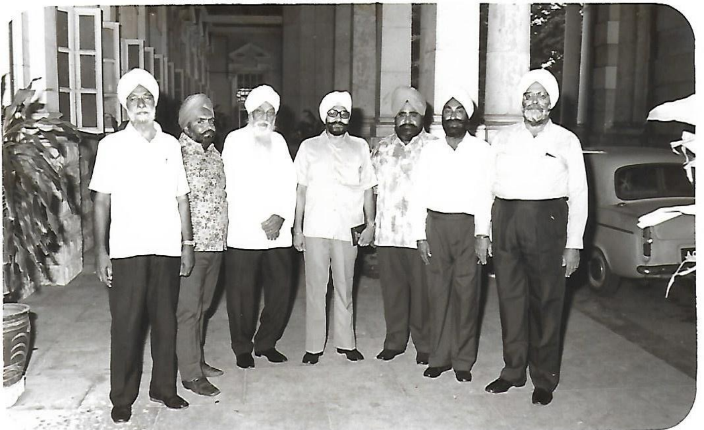
(ਖਾਲਸਾ ਦੀਵਾਨ ਈਪੋਹ ਵੱਲੋਂ ਦੀ ਵਿਦਾਇਗੀ)