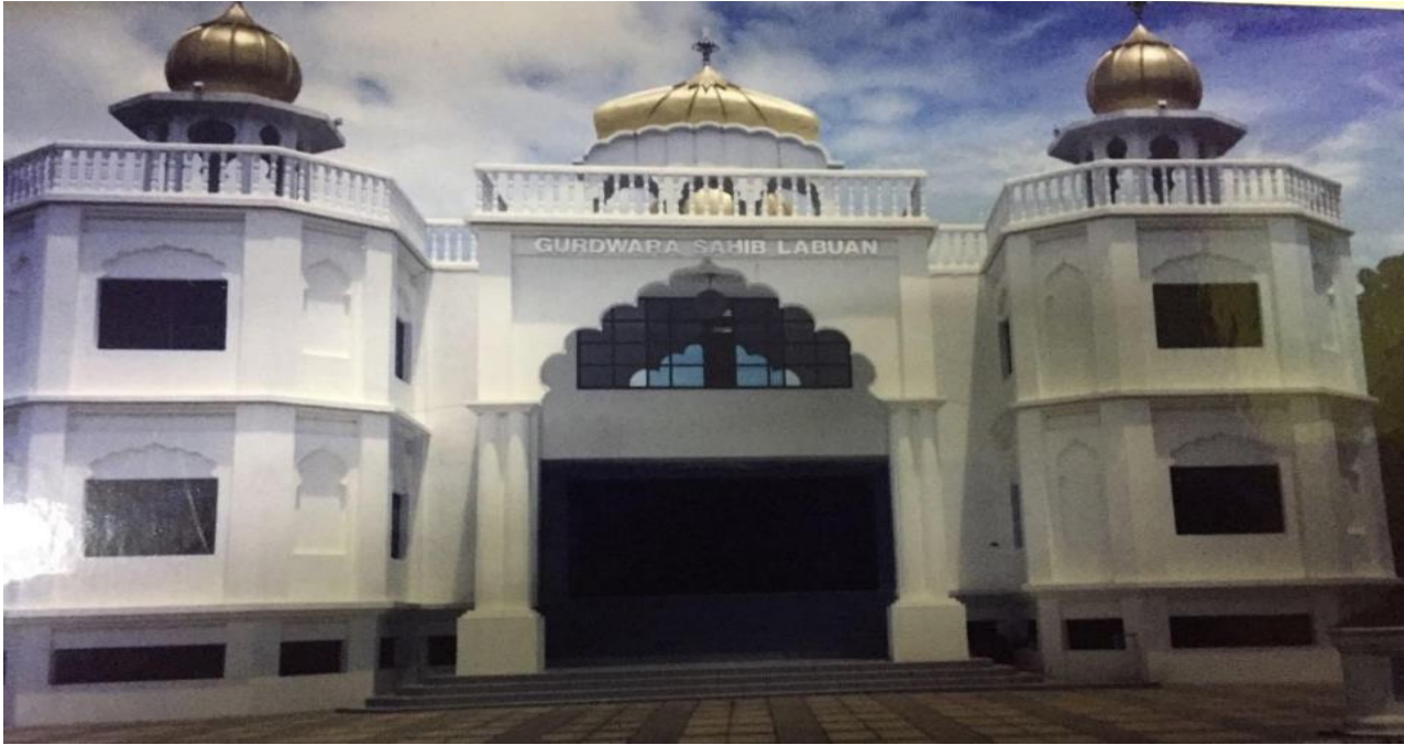
(ਵਿਕਟੋਰੀਆ ਦਾ ਸਿੱਖ ਗੁਰਦੁਆਰਾ)

ਨੇ ਬਾਕਾਇਦਾ ਗੁੰਥੀ ਸਿੰਘ ਤੇ ਰਾਗੀ ਜੱਥਾ ਵੀ ਰੱਖਿਆ ਹੋਇਆ ਹੈ ।