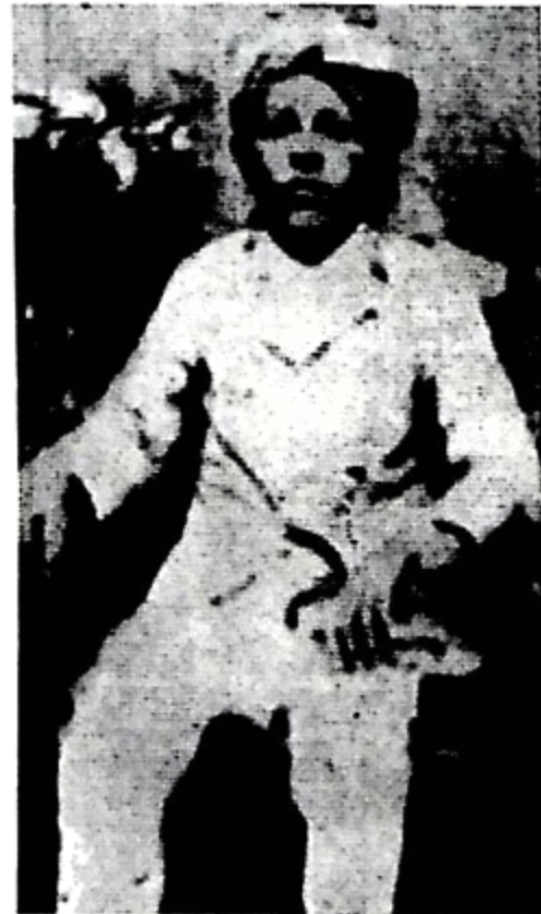
12 ਸਾਲ ਦਾ ਅੱਲੜ ਭਗਤ ਸਿੰਘ