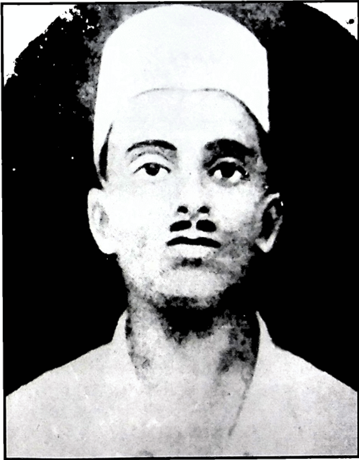
ਸ਼ਹੀਦ ਸੁਖਦੇਵ (ਸ਼ਹਾਦਤ 23 ਮਾਰਚ, 1931)