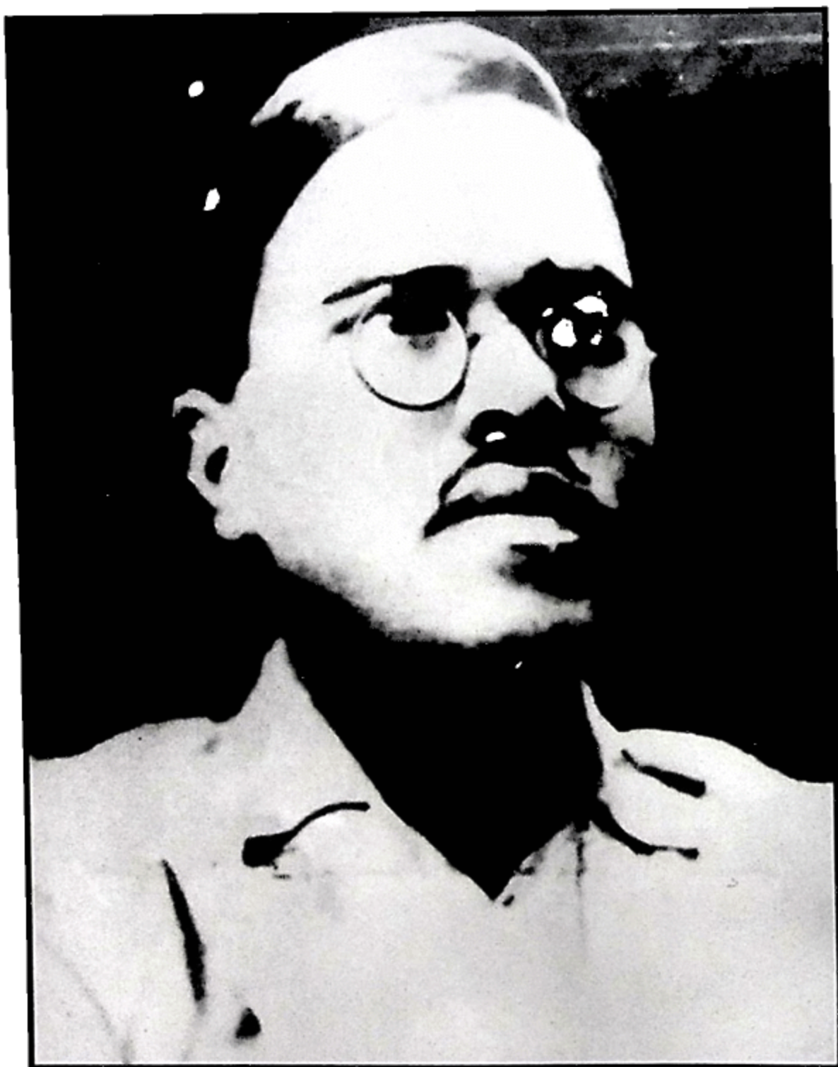
ਸ਼ਹੀਦ ਭਗਵਤੀ ਚਰਨ ਵੋਹਰਾ ਲਾਹੌਰ ਰਾਵੀ ਕੰਢੇ ਬੰਬ ਵਿਸਫੋਟ ਨਾਲ ਸ਼ਹਾਦਤ (27 ਮਈ, 1930)