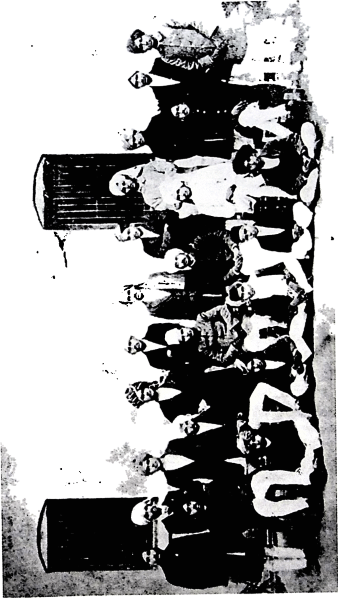
ਕੌਮੀ ਕਾਲਜ ਲਾਹੌਰ ਵਲੋਂ ਖੇਡੇ ਗਏ ਹਿੰਦੀ ਨਾਟਕ 'ਭਾਰਤ ਦੁਰਦਸ਼ਾ' ਦੀ ਨਾਟਕ ਟੋਲੀ ਨਾਲ ਭਗਤ ਸਿੰਘ (ਸੱਜਿਓ ਚੌਥੇ)