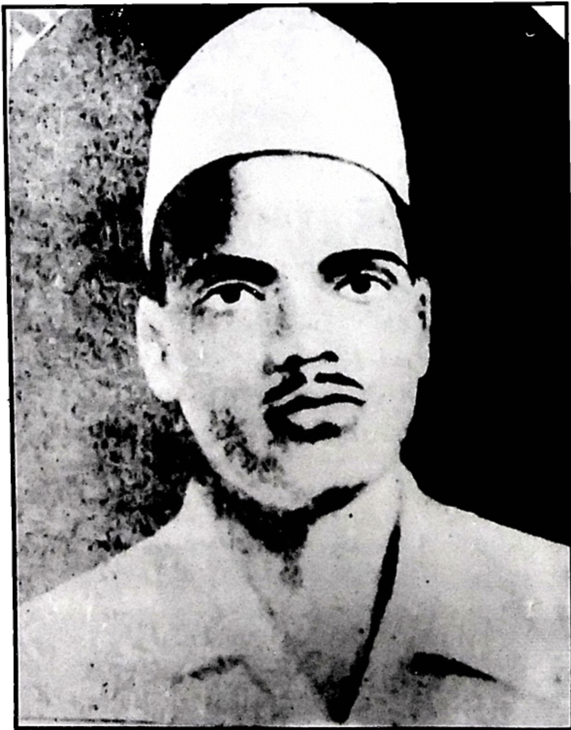
ਬਹੀਦ ਸ਼ਿਵ ਰਾਮ ਰਾਜਗੁਰੂ (ਸ਼ਹਾਦਤ 23 ਮਾਰਚ, 1931)