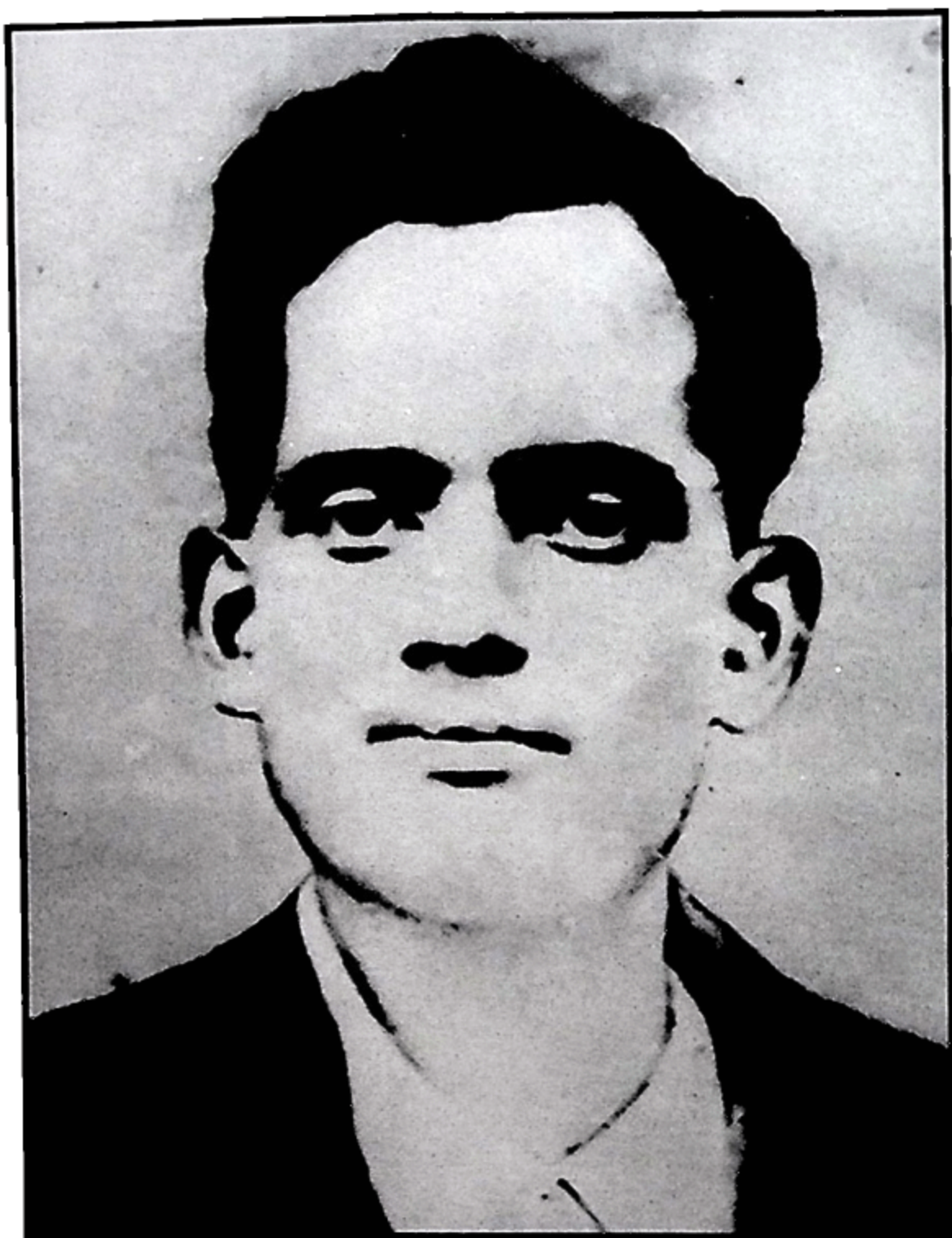
ਸ਼ਹੀਦ ਜਤਿੰਦਰ ਨਾਥ ਦਾਸ 63 ਦਿਨ ਲੰਮੀ ਹੜਤਾਲ ਤੋਂ ਬਾਅਦ ਸ਼ਹਾਦਤ (13 ਸਤੰਬਰ, 1929)