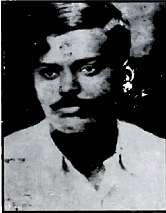
ਸ਼ਹੀਦ ਚੰਦਰ ਸ਼ੇਖਰ ਆਜ਼ਾਦ ਅਲਾਹਾਬਾਦ ਦੇ ਐੱਲਫਰੈਡ ਪਾਰਕ ਵਿਚ ਪੁਲਿਸ ਮੁਕਾਬਲੇ ਵਿਚ ਸ਼ਹਾਦਤ (27 ਫਰਵਰੀ, 1931)