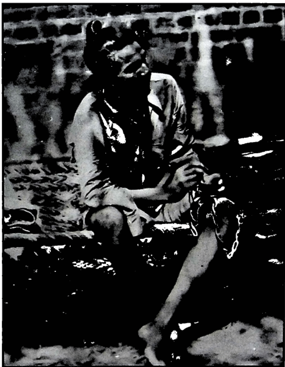
ਸ਼ਹੀਦ ਭਗਤ ਸਿੰਘ, ਪਹਿਲੀ ਗ੍ਰਿਫ਼ਤਾਰੀ ਸਮੇਂ ਲਾਹੌਰ (ਮਈ 1927)