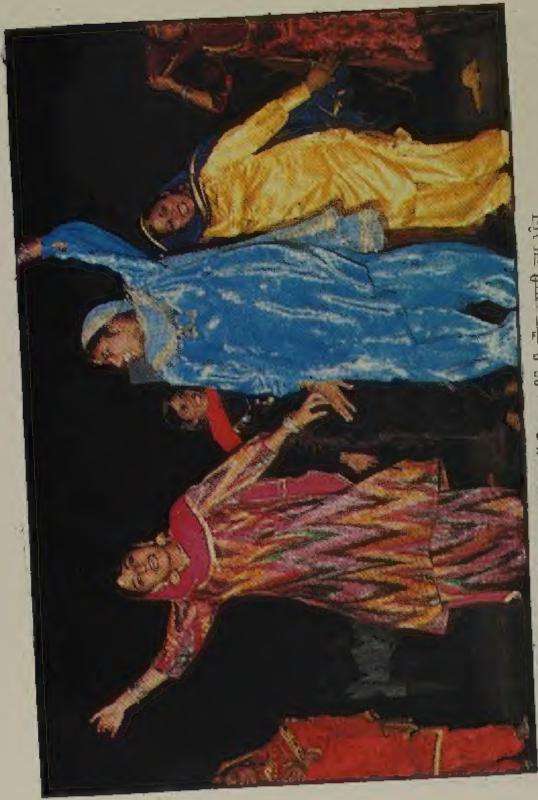
ਨੱਚਣ ਵਾਲੀ ਦੀ ਅੱਡੀ ਨਾ ਰਹਿੰਦੀ ਗੋਣ ਵਾਲੀ ਵਾਂਗ ਮੂੰਹ