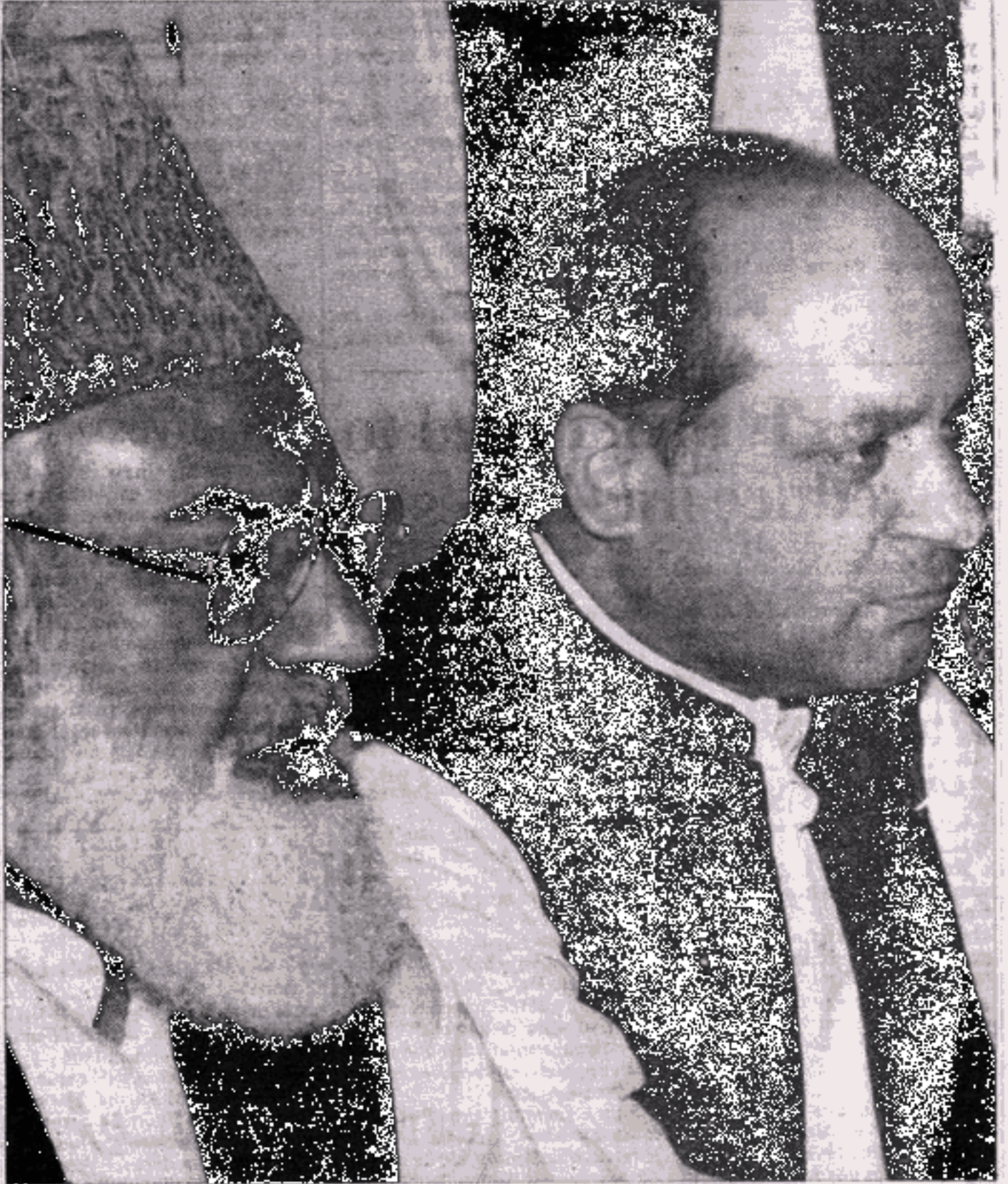
مسلم لیگ کے صدر نواز شریف اور جماعت اسلامی کے امیر قاضی حسین احمد منصورہ میں بات چیت کرتے ہوئے۔