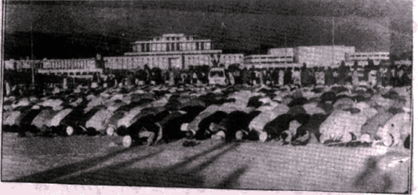
پارلیمنٹ ہاؤس کے باہر دھرنے کے شرکاء منور حسن کی اقتداء میں نماز ادا کر رہے ہیں۔