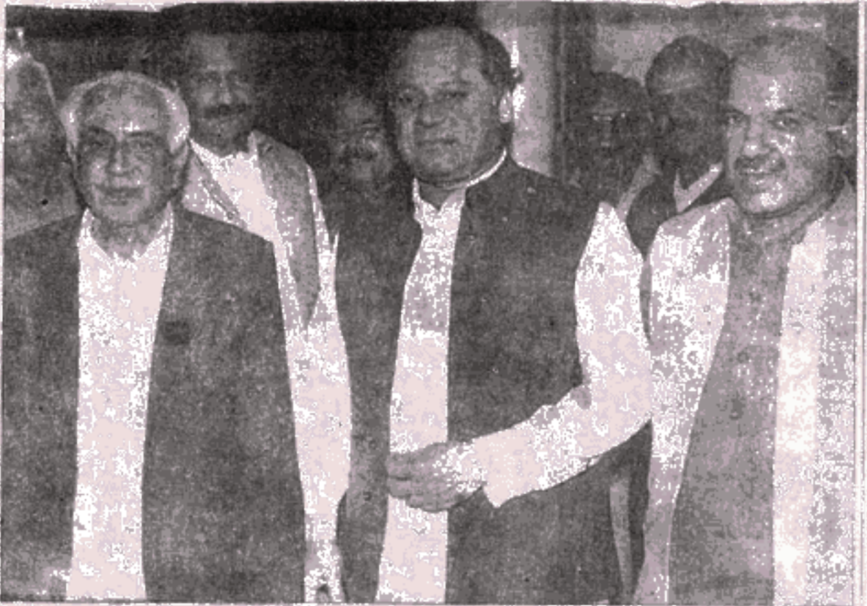
نگران وزیر اعظم معراج خالد مسلم لیگی راہنما میاں نواز شریف اور میاں شہباز شریف کے ہمراہ