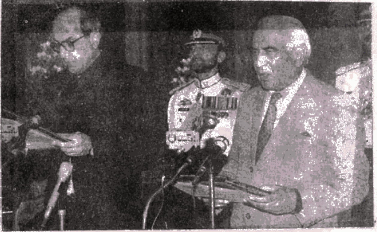
صدر فاروق لغاری نگران وزیر اعظم معراج خالد سے حلف لیتے ہوئے

میں نے اپنے دل سے دعا کی ہے کہ اللہ تعالیٰ ان سب کو اپنا خاص فضل و کرم سے نوازا کرے اور ان کے لیے سب سے بہتر اور سب سے زیادہ نیک اور نیکو کاموں میں سے ان کو کامیاب کرے۔ آمین