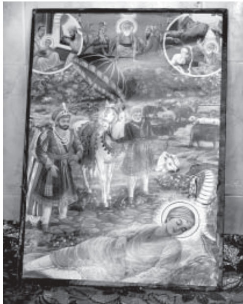
ਆਲੇ 'ਚ ਰੱਖੀ ਬਾਬੇ ਨਾਨਕ ਦੀ ਕਰਾਮਾਤੀ ਤਸਵੀਰ

ਗੁਰਦਵਾਰਾ ਮਾਲ ਜੀ ਬਾਰੇ ਇਹ ਮਸ਼ਹੂਰ ਹੈ ਕਿ ਉਥੇ ਬਾਬਾ ਨਾਨਕ ਨੂੰ ਮੱਝਾਂ ਚਾਰਦੇ ਹੋਏ, ਅਰਾਮ ਕਰਦਿਆਂ ਸਮੇਂ, ਸੱਪ ਨੇ ਛਾਂ ਕਰ ਦਿਤੀ ਸੀ। ਇਸ ਗੁਰਦਵਾਰੇ ਵਿਚ ਇਕ ਰੁੱਖ ਉਤੇ ਲੀਰਾਂ ਬੰਨ੍ਹੀਆਂ ਹੋਈਆਂ ਹਨ ਜਿਨ੍ਹਾਂ ਬਾਰੇ ਦਸਿਆ ਗਿਆ ਕਿ ਸ਼ਰਧਾਲੂ ਅਪਣੀਆਂ ਸੁੱਖਾਂ ਪੂਰੀਆਂ ਹੋਣ 'ਤੇ ਬੰਨ੍ਹ ਜਾਂਦੇ ਹਨ। ਗੁਰਦਵਾਰੇ ਵਿਚ ਹੀ ਇਕ ਪਾਸੇ ਇਕ ਥੜਾ ਜਿਹਾ ਬਣਿਆ ਹੋਇਆ ਜਿਸ ਵਿਚ ਬਣੇ ਆਲੇ ਵਿਚ ਗੁਰੂ ਨਾਨਕ ਸਾਹਿਬ ਦੀ ਉਹ ਤਸਵੀਰ ਰੱਖੀ ਹੋਈ ਹੈ ਜਿਸ ਵਿਚ ਸੱਪ ਨੂੰ ਉਨ੍ਹਾਂ ਦੇ ਸਿਰ ਉਤੇ ਛਾਂ ਕਰਦੇ ਵਿਖਾਇਆ ਗਿਆ ਹੈ। ਜਿਨ੍ਹਾਂ ਨੇ ਅੰਮ੍ਰਿਤ ਛਕਿਆ