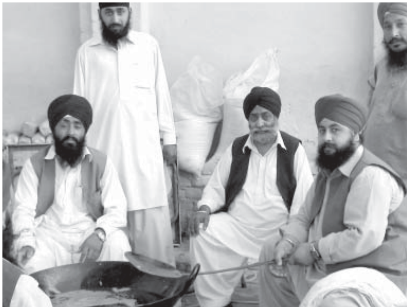
ਪਿਸ਼ੌਰੀ ਸਿੱਖ ਹਸਨ ਅਬਦਾਲ ਵਿਖੇ ਲੰਗਰ ਤਿਆਰ ਕਰਦੇ ਹੋਏ।

ਹਸਨ ਅਬਦਾਲ ਗੁਰਦਵਾਰੇ ਵਿਚ ਇਕ ਤਰ੍ਹਾਂ ਨਾਲ ਪਿਸ਼ੌਰੀ ਸਿੱਖਾਂ ਦਾ ਕਬਜ਼ਾ ਹੈ ਤੇ ਸਿੱਖੀ ਦੀ ਵੀ ਉਨ੍ਹਾਂ ਦੀ ਅਪਣੀ ਹੀ ਗਿਣਤੀ ਹੈ। ਇਕ ਦਿਨ ਰਾਤ ਨੂੰ ਤਾਂ ਸਾਰੀ