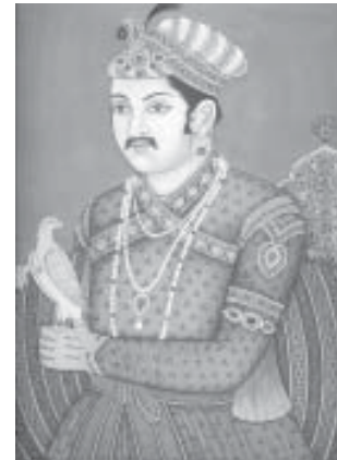
ਜਲਾਲ-ਉਦ-ਦੀਨ ਮੁਹੰਮਦ ਅਕਬਰ

ਲਾਹੌਰ ਦੇ ਸ਼ਾਹੀ ਕਿਲ੍ਹੇ ਦੀ ਸ਼ੁਰੂਆਤ ਦਾ ਦੌਰ ਮੁਗ਼ਲ ਕਾਲ ਨਾਲ ਜੁੜਦਾ ਹੈ। ਜਲਾਲ-ਉਦ-ਦੀਨ ਮੁਹੰਮਦ ਅਕਬਰ (1556-1605 ਈਸਵੀ) ਨੇ ਸੱਭ ਤੋਂ ਪਹਿਲਾਂ ਇਸ ਕਿਲ੍ਹੇ ਦੀ ਉਸਾਰੀ ਕਰਵਾਈ ਸੀ। ਨੂਰ-ਉਦ-ਦੀਨ ਜਹਾਂਗੀਰ (1605-1627 ਈਸਵੀ) ਤੇ ਸਾਹਿਬ-ਉਦ-ਦੀਨ ਸ਼ਾਹ ਜਹਾਨ (1627-1658) ਈਸਵੀ ਨੇ ਇਸ ਵਿਚ ਵੱਖ-ਵੱਖ ਮਹਿਲ ਬਣਾ ਕੇ, ਇਸ ਦੀ ਇਮਾਰਤਸਾਜ਼ੀ ਵਿਚ ਵਾਧਾ ਕੀਤਾ। ਔਰੰਗਜ਼ੇਬ ਆਲਮਗੀਰ (1658-1707) ਨੇ ਕਿਲ੍ਹੇ ਦੇ ਆਲਮਗੀਰੀ ਗੇਟ ਸਾਹਮਣੇ ਬਾਦਸ਼ਾਹੀ ਮਸਜਿਦ ਦੀ ਉਸਾਰੀ ਕਰਵਾਈ। ਲਾਹੌਰ ਦੇ ਇਤਿਹਾਸ ਦਾ ਸਿੱਖਾਂ ਨਾਲ ਵੀ ਗੂੜ੍ਹਾ ਸਬੰਧ ਰਿਹਾ ਹੈ। 1767 ਈਸਵੀ ਤੋਂ 1798 ਈਸਵੀ ਤਕ ਲਾਹੌਰ 'ਤੇ ਤਿੰਨ ਸਿੱਖ ਸਰਦਾਰਾਂ ਗੁੱਜਰ ਸਿੰਘ, ਲਹਿਣਾ ਸਿੰਘ ਤੇ ਸ਼ੋਭਾ ਸਿੰਘ ਨੇ ਰਾਜ ਕੀਤਾ। 1799 ਤੋਂ 1839 ਤਕ ਮਹਾਰਾਜਾ ਰਣਜੀਤ ਸਿੰਘ ਦੀ ਅਗਵਾਈ ਹੇਠ ਖ਼ਾਲਸਾ ਰਾਜ ਦੇ ਝੰਡੇ ਝੂਲਦੇ ਰਹੇ।