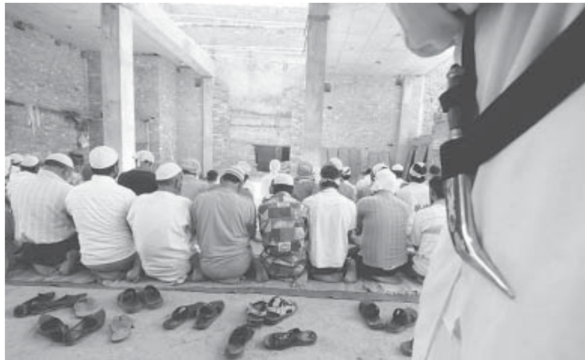
ਧੂਰੀ ਨੇੜੇ ਪਿੰਡ ਰਤੀਆ 'ਚ ਮੁਸਲਮਾਨਾਂ ਨੂੰ ਨਮਾਜ਼ ਪੜ੍ਹਦੇ ਦੇਖਦਾ ਹੋਇਆ ਇਕ ਸਿੱਖ

ਕੀਤਾ ਸੀ। ਉਸ ਦੇ ਜਿਉਂਦੇ-ਜਿਉਂਦੇ ਤਾਂ ਇਹ ਹਾਲਾਤ ਮੁੜ ਨਾ ਬਣ ਸਕੇ। ਪਰ ਹੁਣ ਹਾਲਾਤ ਬਦਲ ਰਹੇ ਹਨ। ਪੰਜਾਬ ਦੇ ਹਰ ਪਿੰਡ ਅਤੇ ਮੋੜ ਤੋਂ 'ਅੱਲਾ ਹੂ' ਦੀ ਆਵਾਜ਼ ਆਉਣ ਲੱਗੀ ਹੈ। ਬਹੁਤੇ ਪਿੰਡਾਂ ਵਿਚ ਟੋਪੀਆਂ ਵਾਲੇ ਮੁਸਲਮਾਨ ਘੁੰਮਦੇ ਵਿਖਾਈ ਦੇਣ ਲੱਗੇ ਹਨ। ਮਸਜਿਦਾਂ ਆਬਾਦ ਹੋ ਰਹੀਆਂ ਹਨ। ਗ਼ੈਰ-ਮੁਸਲਮਾਨ, ਮੁਸਲਮਾਨਾਂ ਨੂੰ ਮੁੜ ਵਸਾਉਣ ਅਤੇ ਰਾਖੀ ਦੇਣ ਵਿਚ ਮਾਣ ਮਹਿਸੂਸ ਕਰਨ ਲਗੇ ਹਨ। ਰੋਪੜ, ਲੁਧਿਆਣਾ ਅਤੇ ਗੁਰਦਾਸਪੁਰ ਵਿਖੇ ਸਿੱਖਾਂ ਵਲੋਂ ਪੁਰਾਣੀਆਂ ਮਸਜਿਦਾਂ ਦੀ ਮੁੜ-ਉਸਾਰੀ ਕਰ ਕੇ