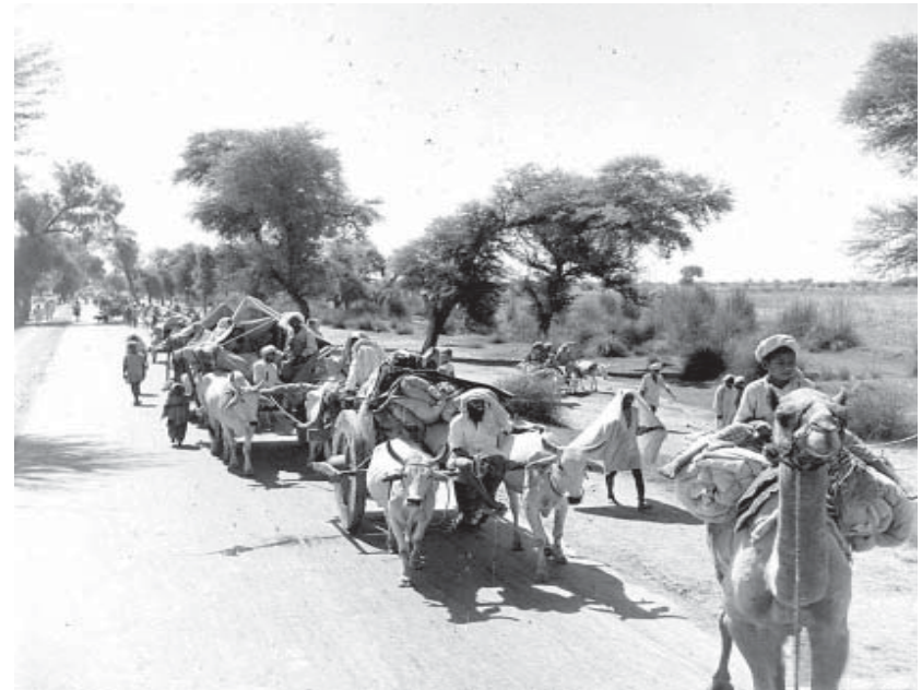
47 'ਚ ਧਰਮ ਦੇ ਠੋਕੇਦਾਰਾਂ ਹੱਥੋਂ ਬੇਵਤਨ ਹੋਇਆਂ ਦਾ ਕਾਫ਼ਲਾ