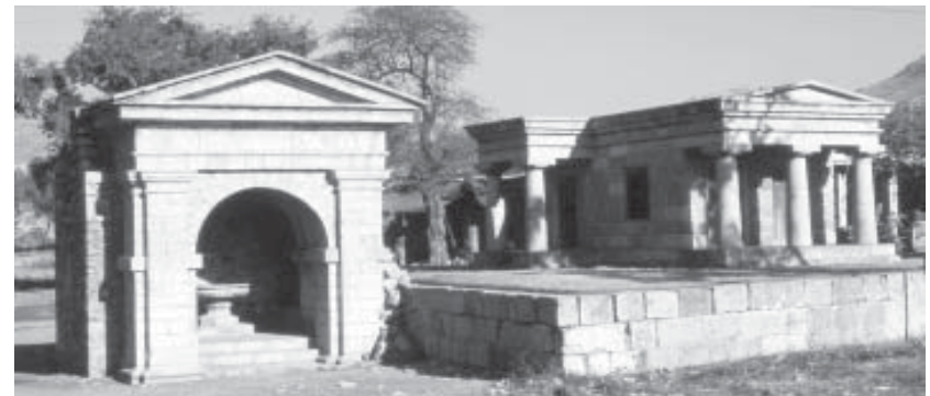
ਪੰਜਾਬ ਦਾ ਪੁਰਾਣਾ ਸ਼ਹਿਰ ਤਕਸ਼ਿਲਾ

ਮਾਂ-ਬੋਲੀ ਦੇ ਇਸ ਤਵਾਰੀਖ਼ੀ ਪਿਛੋਕੜ ਨੂੰ ਵੇਖ ਕੇ ਪੰਜਾਬੀ ਨੂੰ ਅਪਣੀ ਮਾਂ ਬੋਲੀ ਕਹਿਣ ਵਿਚ ਮਾਣ ਮਹਿਸੂਸ ਹੁੰਦਾ ਹੈ। ਇਹ ਗੱਲ ਵੀ ਚਿੱਟੇ ਦਿਨ ਵਾਂਗ ਸਾਫ਼ ਹੈ ਕਿ ਪਿਛੋਕੜ ਵਿਚ ਮਾਂ-ਬੋਲੀ ਹਰ ਥਾਂ ਸਿਰ ਕੱਢਵੀਂ ਨਜ਼ਰ ਆਉਂਦੀ ਹੈ। ਪੰਜਾਬੀ ਕਿਸੇ ਧਰਮ,