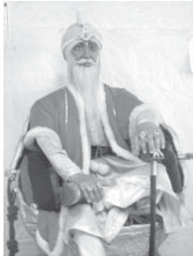
ਮਹਾਰਾਜਾ ਰਣਜੀਤ ਸਿੰਘ

ਇਮਾਰਤ ਨੂੰ ਮਹਾਰਾਜਾ ਰਣਜੀਤ ਸਿੰਘ ਅਪਣੀ ਅਦਾਲਤ ਵਜੋਂ ਵਰਤਦਾ ਸੀ। ਇਸ ਨੂੰ ਬਣਾਉਣ ਲਈ ਚਿੱਟੇ ਅਤੇ ਲਾਲ ਸੰਗਮਰਮਰ ਦੀ ਵਰਤੋਂ ਕੀਤੀ ਗਈ ਹੈ। ਸ਼ਾਹੀ ਕਿਲ੍ਹੇ ਵਿਚ ਤਿੰਨ ਅਜਾਇਬ ਘਰ ਹਨ। ਮੁਗ਼ਲ ਗੈਲਰੀ ਖ਼ਾਬਗਾਹ ਜਹਾਂਗੀਰ ਵਿਚ, ਅਸਲਾਖ਼ਾਨਾ ਅਜਾਇਬ ਘਰ ਦਲਾਨ-ਏ-ਸੰਗ ਵਿਚ ਤੇ ਸਿੱਖ ਗੈਲਰੀ ਮਹਾਰਾਣੀ ਜਿੰਦਾਂ ਦੀ ਹਵੇਲੀ ਵਿਚ ਬਣੀ ਹੋਈ ਹੈ। ਮੁਗ਼ਲ ਗੈਲਰੀ ਵਿਚ ਇਤਿਹਾਸਕ ਖਰੜੇ, ਪੁਰਾਣੇ ਚਿੱਤਰ, ਸਿੱਕੇ ਆਦਿ ਰੱਖੇ ਹੋਏ ਹਨ। ਅਸਲਾ ਅਜਾਇਬ ਘਰ ਵਿਚ ਅੰਗਰੇਜ਼ਾਂ ਅਤੇ ਸਿੱਖਾਂ ਦੀਆਂ ਲੜਾਈਆਂ ਵਿਚ ਵਰਤੇ ਗਏ ਹਥਿਆਰ ਰੱਖੇ ਹੋਏ ਹਨ। ਮਹਾਰਾਣੀ ਬੰਬਾ ਵਲੋਂ ਮਹਾਰਾਜਾ ਰਣਜੀਤ ਸਿੰਘ ਨਾਲ ਜੁੜੀਆਂ ਚੀਜ਼ਾਂ ਸਿੱਖ ਗੈਲਰੀ ਵਿਚ ਰਖੀਆਂ ਹੋਈਆਂ ਹਨ।